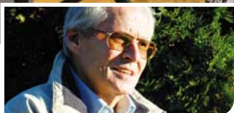
Gode minner frå Volda