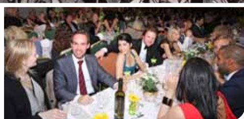
Fest for jubilentane