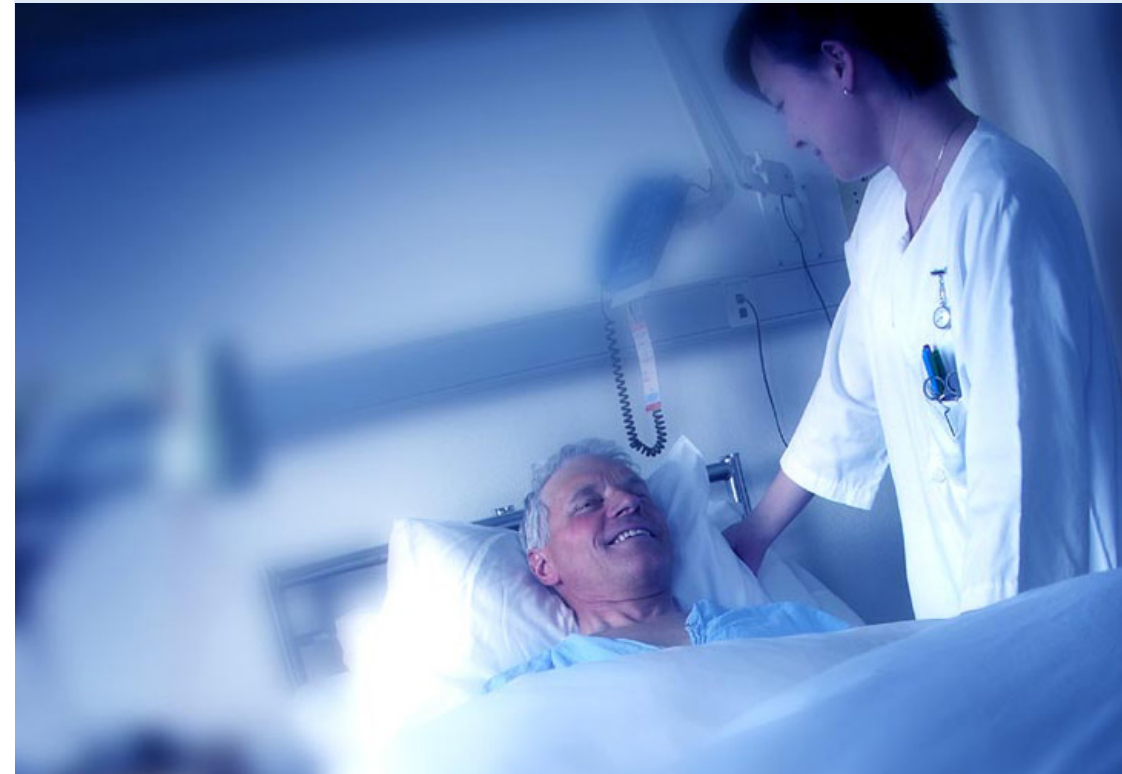
Kven er vi?

Radiologisk avdeling består av ei røntgeneining ved Ålesund sjukehus og ei røntgeneining ved Volda sjukehus. Røntgeneininga i Ålesund er organisert i to seksjonar: brystdiagnostisk senter (BDS) og generell røntgen.